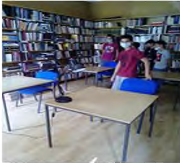
7. у Народној библиотеци