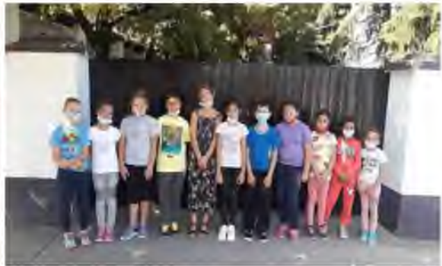
4. у Музеју-Спомен кући Ђура Јакшић